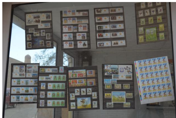
Postzegelwinkeltje in Khiva (Oezbekistan)

Als je dan denkt, dat men in Oezbekistan wel geen postzegels zal verzamelen, loop je in Khiva, een stadje verderop, tegen een ongelooflijke verrassing aan. Ik wrijf eerst een paar keer in mijn ogen. Het zal toch niet waar zijn? Ik ben toch wel degelijk in Oezbekistan?!?! Voor mij doemt namelijk een echter postzegelwinkel op!! Ook in Oezbekistan is er wel degelijk belangstelling voor de postzegelhobby. Er bestaan daar ook postzegelverzamelaars!! De postzegelhandelaar heeft zelfs een uitgebreid assortiment. Alleen het zijn allemaal zegels uit Oezbekistan. Andere zegels heeft hij jammer genoeg niet. Maar niet getreurd: ik heb tenslotte weer een fijne postzegelvakantie gehad. Want vakantie of niet, het postzegelen gaat natuurlijk gewoon door!!!!