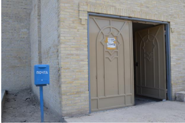
Toegangsdeur hoofdpostkantoor Buchará (Oezbekistan)