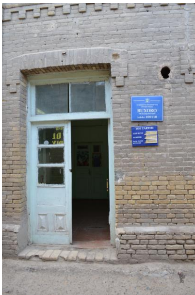
Uiteindelijke ingang van het hoofdpostkantoor van Buchará