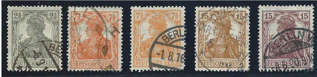
Michel 98-100 inclusief de kleurvarianties

Maar in filatelistisch perspectief keren we terug naar de datum die volgens de Michel catalogus het begin markeerde van de inflatieperioden 1 augustus 1916. Op die dag werden de posttarieven met 50% verhoogd. Om die verhoging van de juiste postzegels te voorzien werden er drie nieuwe zegels uitgegeven die we herkennen als de nummers 98-100 Een brief binnen de gemeente werd daardoor verhoogd van 5 Pf naar 7½ Pf.