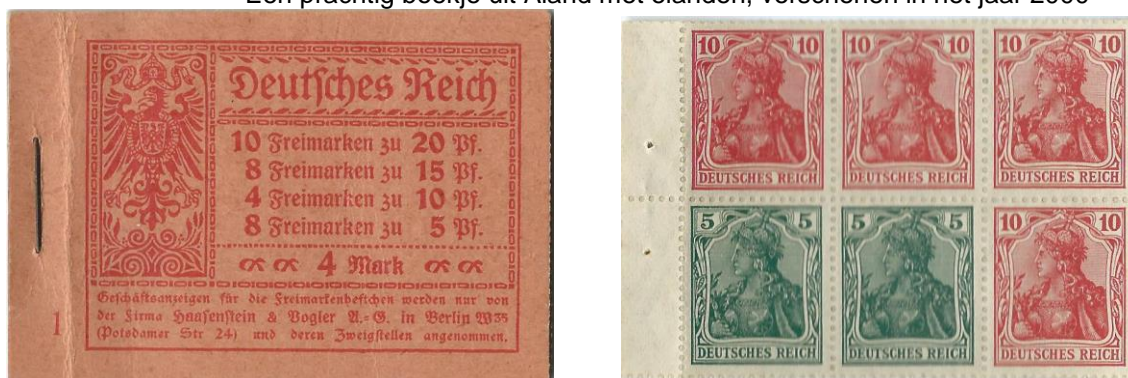
Dit laatste boekje van het Deutsches Reich is verschenen in 1920 en is handmatig in elkaar gezet. Bij de zegels zie je nog twee gaatjes van het nietje zitten. Tegelijk is dit een van de voorbeelden dat er van deze zegels combinaties gemaakt kunnen worden. Bovendien bevinden zich vier bladen, exclusief die op of in de kaft, met reclames in dit boekje.

Aan de opsomming a-m kunt u opmaken dat dit artikel lang niet compleet is. Voor de geïnteresseerde verzamelaars die hier meer over willen weten verwijs ik naar de website van de KNBF. Onder het hoofdstuk Filatelistische vorming vind u nog veel uitgebreider beschreven wat de mogelijkheden zijn. Dit is slechts bedoeld als opwarmertje om u te laten zien dat er nog veel te ontdekken is in filatelieland. Het volledige webadres over dit onderwerp is: https://www.knbf.nl/filatelistische-vorming/bbf-deel-3-02