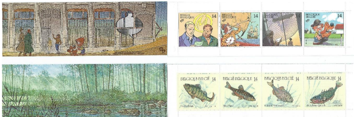
Twee boekjes uit België 1990 en 1991. De motieven zijn duidelijk strips en vissen.