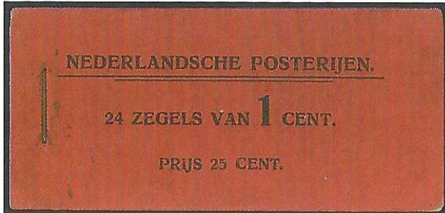
Boekje No 1

Het eerste postzegelboekje in Nederland is reeds in 1902 verschenen. Met een inhoud van zoals u ziet 24 zegels van 1 cent. Voor de productie van deze boekjes die handmatig in elkaar gezet waren berekende men 1 cent.