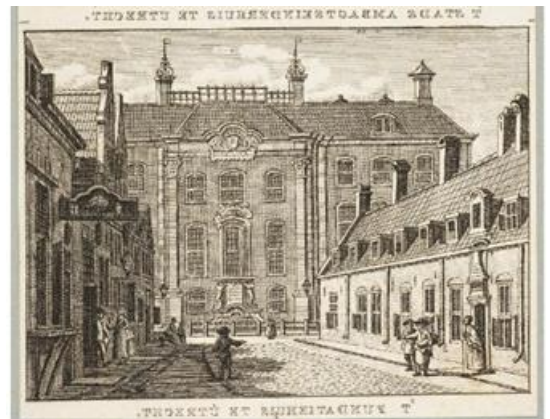
Fundatie van Utrecht in de Agnietenstraat (*5)