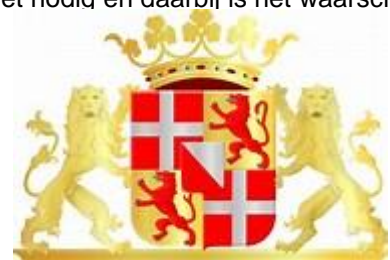
Wapen provincie Utrecht