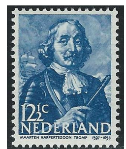
Maarten H. Tromp

Piet Hein werd met grote eer op 4 juli 1629 begraven in de Oude kerk van Delft.