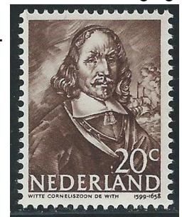
Witte de With

Omdat bekend was dat deze vloot onderweg was bleef de Spaanse vloot in de haven liggen om confrontatie te vermijden. De tweede vloot die in Mexico lag was niet gewaarschuwd en voer uit naar Cuba. Door een storm moest de Hollandse vloot schuilen in de baai bij Havanna. Door deze toevallige samenloop van omstandigheden vielen er 15 schepen vol met kostbaarheden zonder strijd in handen van Piet Hein. De overval in de baai van Matanzas leverde 11½ miljoen gulden op. Na aftrek van de kosten bleef er zo'n 7 miljoen over voor de Staten. Omdat de stadhouder recht had op 10% kreeg die nog eens 700.000 gulden. In die tijd een enorm bedrag, gerekend naar de huidige tijd zo'n half miljard. Holland had nu het geld om de strijd succesvol tegen Spanje voort te zetten. Het verlies van deze zilvervloot zette ook de neerval in van Spanje als wereldmacht.