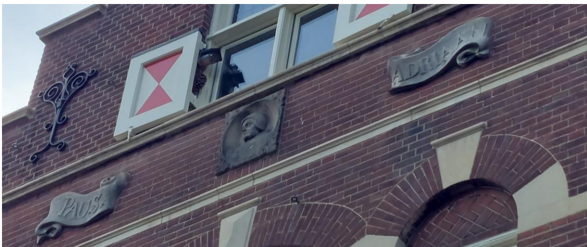
Foto 3 "Paus Adrianus" aangebracht op de gevel van het geboortehuis

Als in 1512 blijkt, dat Ferdinand II van Aragon per testament de broer van Karel, Ferdinand, aanwijst als