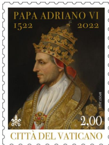
Foto 6 Postzegel van Vaticaanstad uitgegeven op 22-02-2022 tgv de 500e verjaardag van de kroning van Adriaan Boeyens tot paus Adrianus VI

Adriaan Boeijens is tot nu toe de enige Nederlandse paus. Na hem kwamen alleen Italiaanse pausen tot in 1978 de Pool Karol Wojtyła tot paus wordt benoemd. Het is dan ook raar, dat er in 2022, 500 jaar na zijn benoeming tot paus, geen postzegel door Postnl aan hem gewijd wordt.