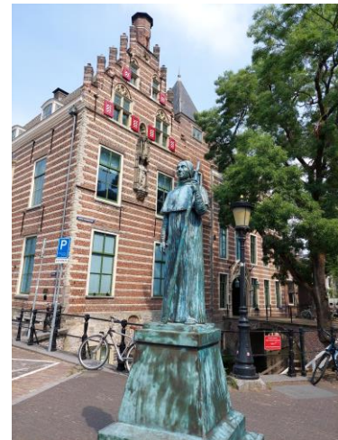
Foto 5 Standbeeld van Adrianus VI voor Paushuize