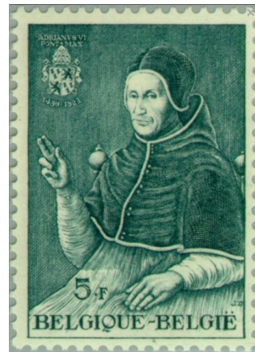
Foto 2 Postzegel uitgegeven door België op 31-08-1959 tgv 500e geboortedag van Adriaan VI naar een schilderij van Jan van Scorel

In 1490 wordt hij tot priester gewijd en zetelt in het kapittel van de Leuvense Sint-Pieterskerk. Naast verschillende nevenfuncties is hij ook kanunnik in