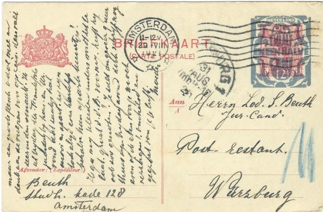
12½ cent op 5 cent Wilhelmina hangend haar. 1921

Ik laat u een compilatie zien van de meest bijzondere briefkaarten die uitgegeven zijn in Nederland. Omwille van de ruimte zijn de afbeeldingen verkleind. Vooral in de 20er en 30er jaren zijn er veel bijzondere briefkaarten leuke en vooral kleurrijke uitgegeven.