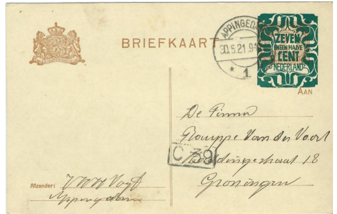
7½ cent op 2 cent cijferzegel 1921