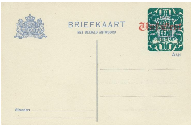
Briefkaart met betaald antwoord 7½ cent op 5 cent op 1½ cent cijferzegel. Tweevoudige opdruk 1921