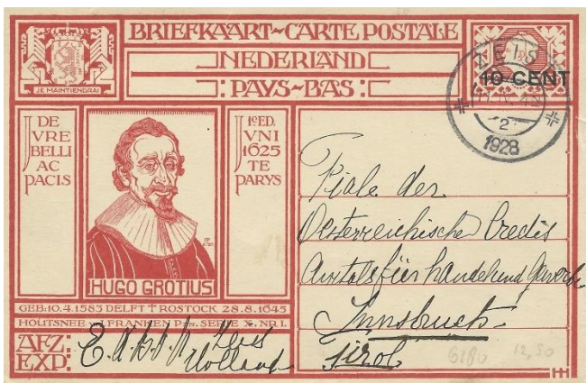
Opdruk 10 cent op 12½. Op 1 oktober 1925 werd het tarief naar het buitenland verlaagd. Hugo de Groot