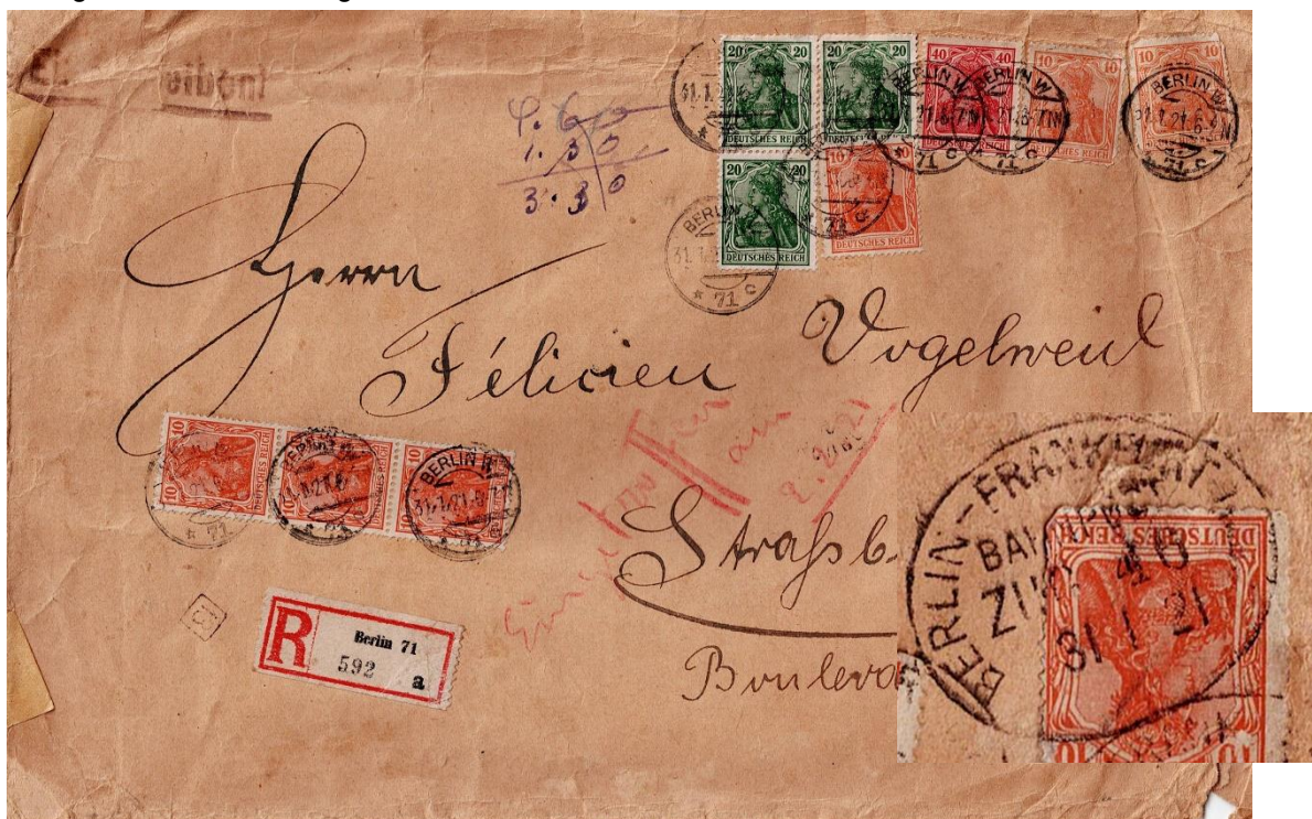
Trajectstempel Zug 46