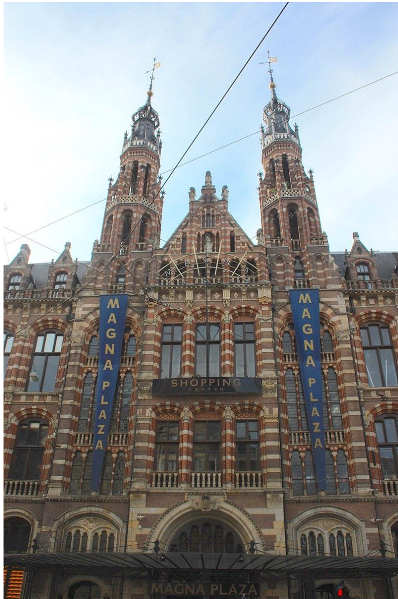
Magna Plaza

In 1992 vestigt zich in het gebouw aan de Nieuwezijds Voorburgwal Magna Plaza, een winkelcentrum.