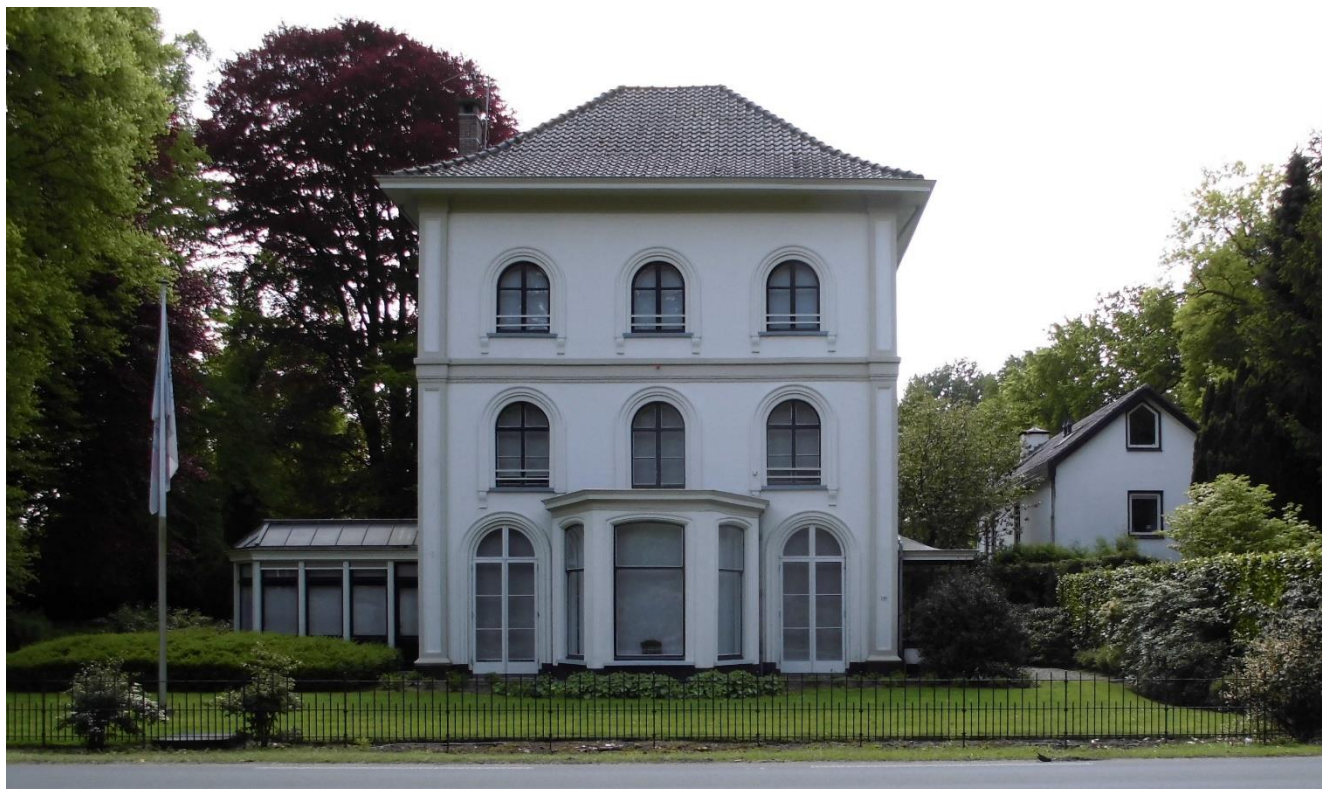
Veldzicht in Driebergen-Rijsenburg (Utrecht) Het ontvangstadres van deze brief.

Voor diegenen die hier meer over weten wil. Kan ik adviseren dit boek via de Bondsbibliotheek te lenen opdat u alles wat hiermee te maken heeft kan terugvinden.