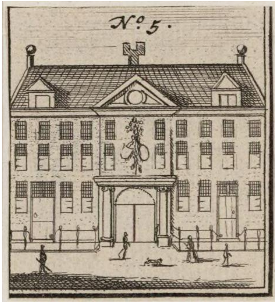
Generaal Postcomptoir naar een prent van Jacobus Verheijden

In 1748 wordt achter het Paleis op de Dam op de Nieuwezijds Voorburgwal 192 een Generaal Postcomptoir ingericht in de voormalige Stadspardenstal, die in 1661 wordt gebouwd bovenop de Donkere Sluis, de waterverbinding tussen Nieuwezijds Voorburgwal en Singel.