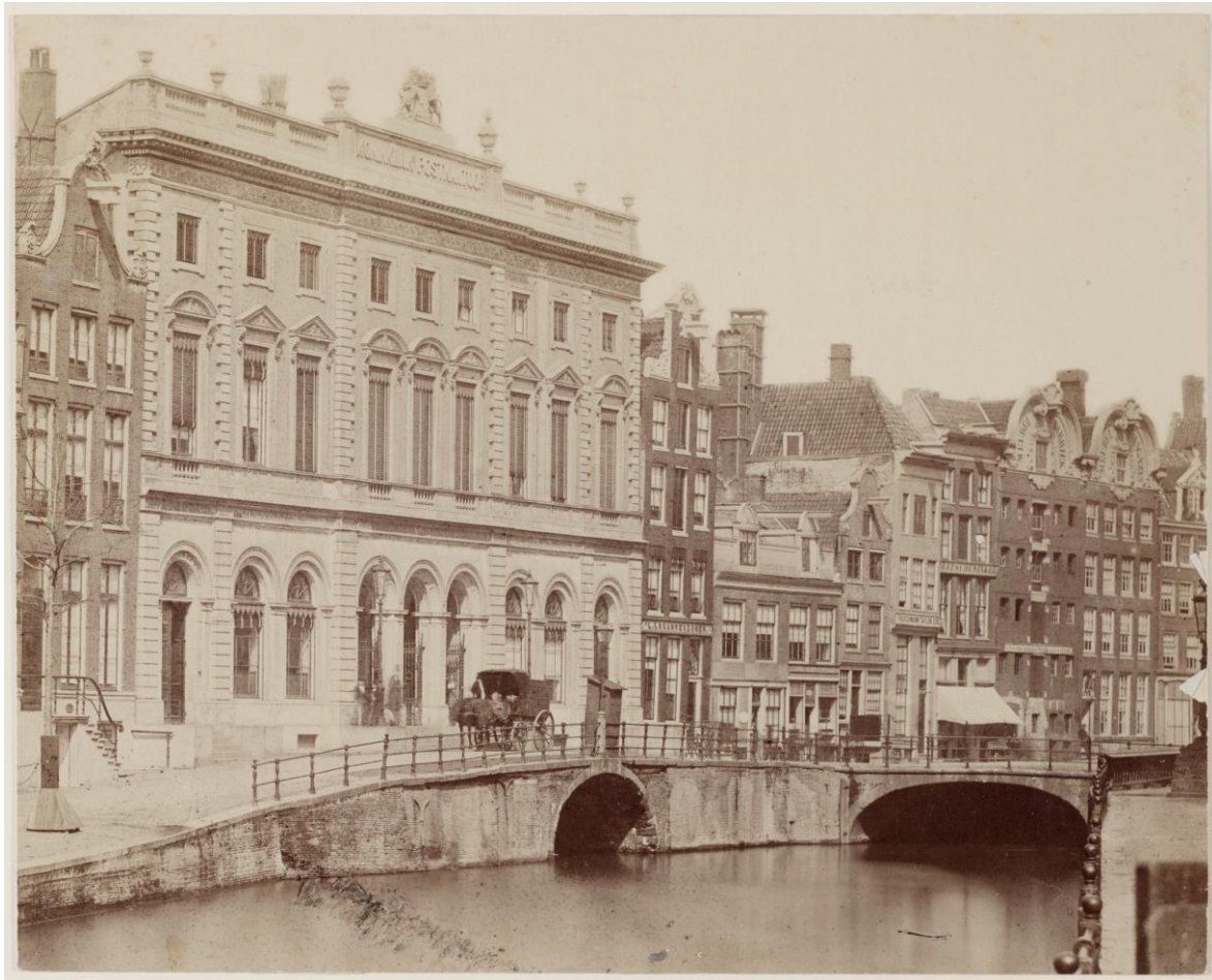
Het Koninklijk Postkantoor in Amsterdam aan de Nieuwezijds Voorburgwal 192

Het gebouw is ontworpen door Cornelis Outshoorn en krijgt als adres ook weer Nieuwezijds Voorburgwal 192. Het heeft op de begane grond een wachtruimte met een glazen plafond, recht onder de lichtkoepel op het dak. Op de eerste verdieping aan de kant van de latere Spuistraat is de seinzaal van het Rijkstelegraafkantoor gevestigd. Door uitbreiding van taken, zoals pakketdienst en telefonie wordt in 1862 op het gebouw een extra verdieping geplaatst.