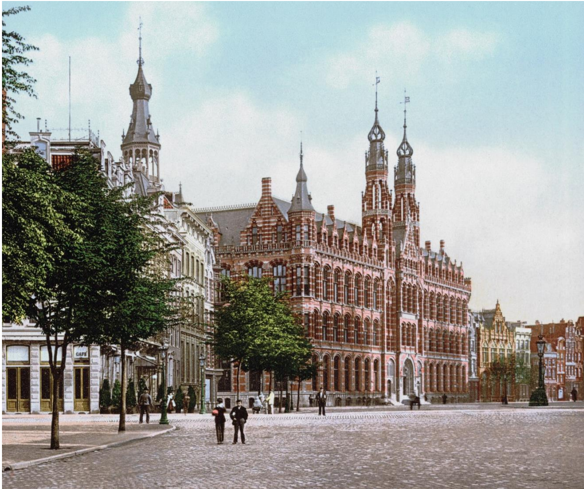
Het Hoofdpostkantoor van Amsterdam vlak na de bouw

Tussen 1895 en 1899 wordt het Hoofdpostkantoor van Amsterdam gebouwd in neogothische en neorenaissancestijl naar een ontwerp van rijksbouwmeester Cornelis Peters. Het gebouw heeft een overvloedig en gevarieerd bakstenen exterieur. De gevels worden voorzien van rijk geprofileerde omlijstingen van vensters en deuren. Langs de dakranden komen een groot aantal dakkapellen met elk een eigen trapgeveltje. De drie torens hebben een peervorm, zodat het gebouw al snel de naam krijgt van Perenburg. Het adres wordt nu Nieuwezijds Voorburgwal 182.