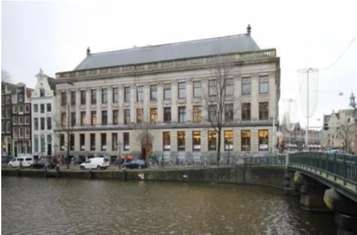
Het Hoofdkantoor in het gebouw van de Amsterdamse Gemeentegiro

In 1988 wordt het Hoofdkantoor aan de Nieuwezijds Voorburgwal gesloten en wordt het verplaatst naar het gebouw van de voormalige Amsterdamse Gemeentegiro op de hoek van Singel en Raadhuisstraat. Dit gebouw wordt in 1921 naar een ontwerp J.P.F. van Rossem en W.J. Vuyk opgetrokken in neoclassistische stijl in eerste instantie als kantoor voor de Nederlandsch-Indische Handelsbank. Na de onafhankelijkheid van Indonesië wordt de naam veranderd in Nationale Handelsbank. In 1960 wordt de bank overgenomen door de Rotterdamsche Bank en verlaat in 1963 het gebouw. Het wordt daarna hoofdkantoor van de Amsterdamse Gemeentegiro. In 1979 wordt de Amsterdamse Gemeentegiro overgenomen door de Postgiro. In 2011 sluit het Hoofdkantoor definitief haar deuren en houdt op te bestaan.