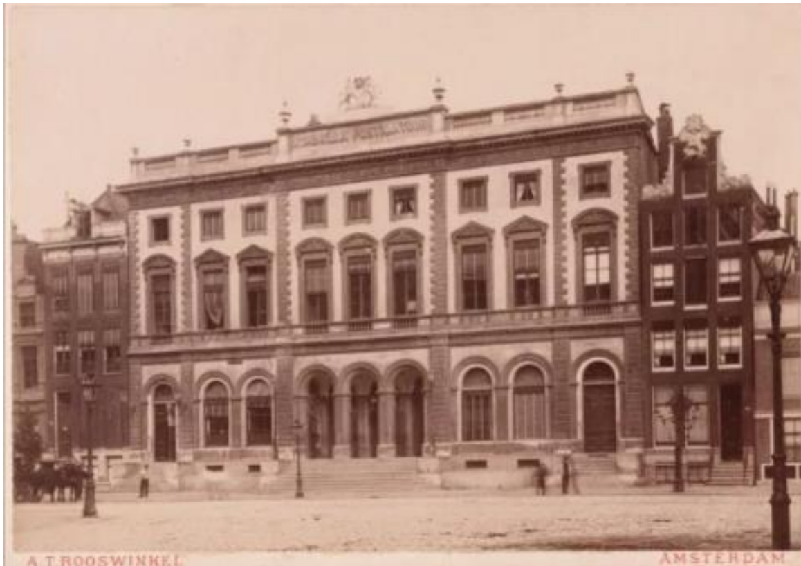
Het Koninklijk Postkantoor in Amsterdam ca. 1890 naar een ansichtkaart van A.T. Rooswinkel (publiek domein)

Het gebouw wordt samen met de rest van het blok in 1894 gesloopt om plaats te maken voor het Hoofdpostkantoor van Amsterdam.