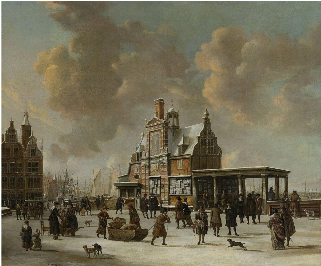
Het Paalhuis naar een schilderij van Jan Abrahamsz. Van Beerstraten

Het allereerste postkantoor in Amsterdam is gevestigd in een belastingkantoor, het Paalhuis. Het is in 1560 gebouwd in Hollandse renaissancestijl aan de noordzijde van de Nieuwe brug aan de tegenwoordige Prins Hendrikkade. Schippers moeten daar paalgeld (havengeld) betalen en kunnen brieven afgeven voor kooplieden, die vervolgens echter vaak te laat of helemaal niet bezorgd worden. Vanaf 1598 betalen geadresseerden bij het ophalen van de brief 1½ dukaat, die later aan de schipper wordt uitbetaald. Dan worden ook brieven afgegeven, die vanuit de hele wereld per boot worden aangevoerd. Later kunnen ook burgers post afgeven en worden er postbussen bij het Paalhuis geplaatst.