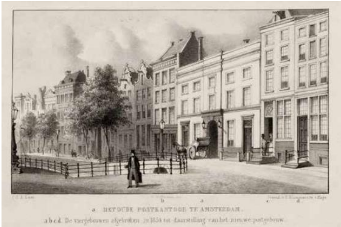
Vóór het postcomptoir staat een rijtuig te wachten. Rechts van de man op de voorgrond is nog net de toegang tot de Donkere Sluis te zien

Honderd jaar later wordt het te klein en moet het samen met het huis links en twee huizen rechts in 1854 wijken voor een nieuw gebouw, dat in 1856 gereed komt, het Koninklijk Postkantoor.