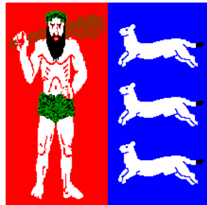
De vlag van Fins Lapland

Het kan er flink koud zijn tot wel -25^{\circ}\text{C} . De ramen van de gebouwen zijn dan ook relatief klein met triple ramen in plaats van dubbele beglazing. In Rovaniemi komen de rivieren Kemijoki en Ounasjoki samen. De stad is officieus de hoofdstad van Lapland, het land van de Sami. Officiëel is het de hoofdstad van Fins Lapland.