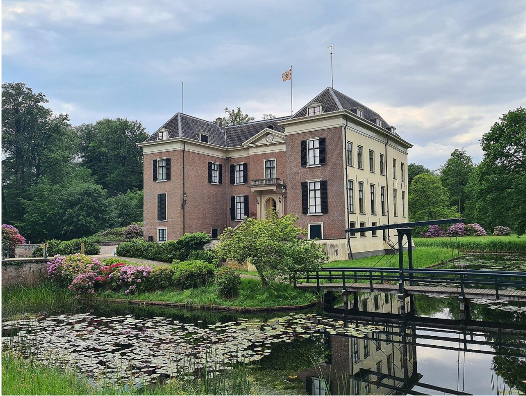
Afb. 3 Huis Doorn

In het land waren diverse opstanden en revoluties ontstaan na het voorbeeld van de Russische revolutie. In Duitsland zag het leger kans om dit de kop in te drukken. Zoals bekend is in Rusland na een bloedige revolutie de Sovjet-Unie in 1922 uitgeroepen.