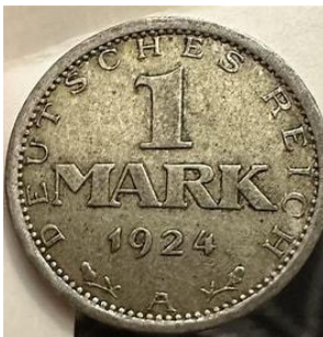
Afb 8 en 9

In 1924 werd de geldhervorming afgerond met de invoering van de Reichsmark (afb. 8 en 9) met dezelfde waarde als de Rentenmark.