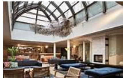
Binnenkant vd Kerk hoe mooi

Kortom een schitterend land om eens te bezoeken. Persoonlijk had ik niet zo een hoge pet op van Finland,