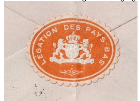
Sluitzegel op achterzijde envelop

Zo werden in de jaren 70 de laatste Nederlandse gezantschappen verheven tot ambassade.